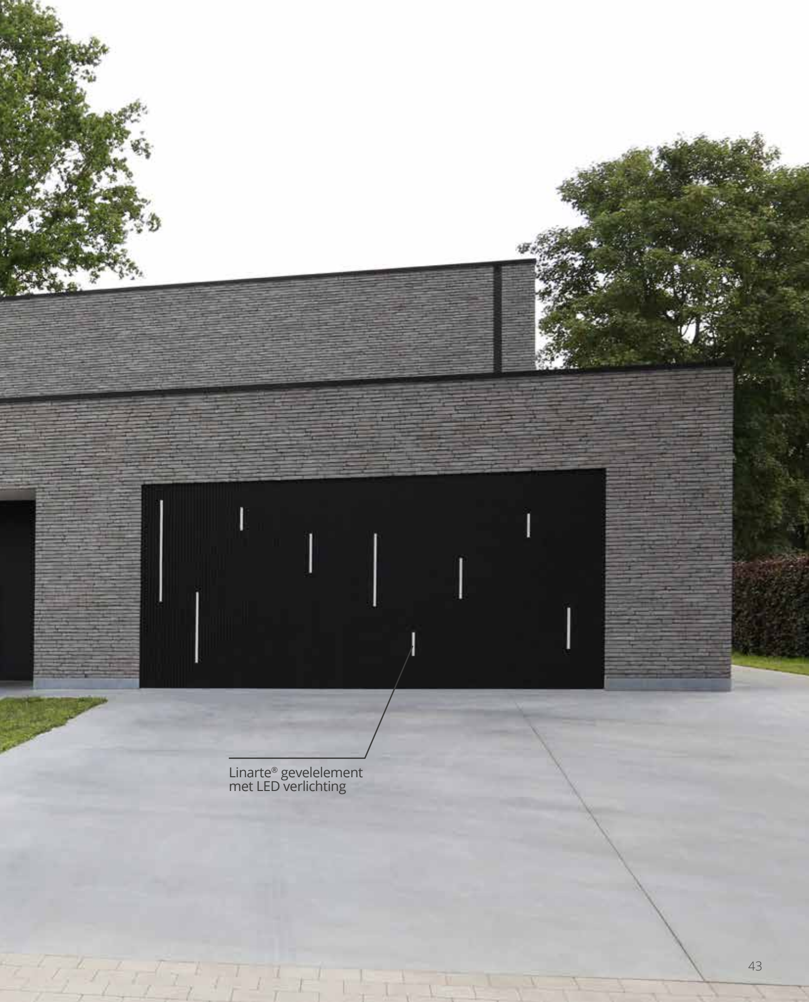
Linarte® gevelement met LED verlichting