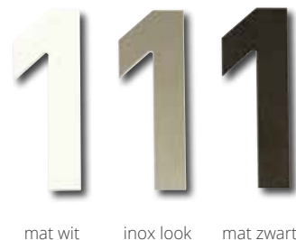
mat wit inox look mat zwart

Vergeet bij de aankoop van je bus je huisnummer niet, eSafe biedt cijfers in 3 kleuren en 5 of 10 cm hoogte aan.