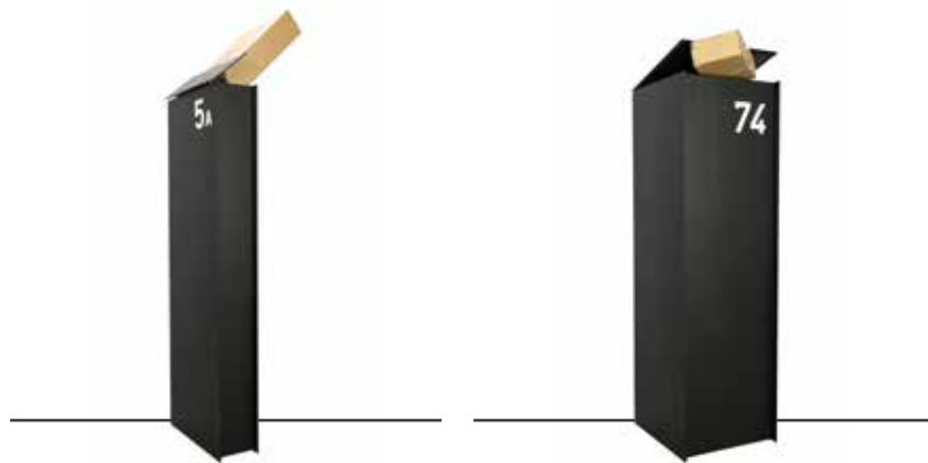
FENIX TOP Small